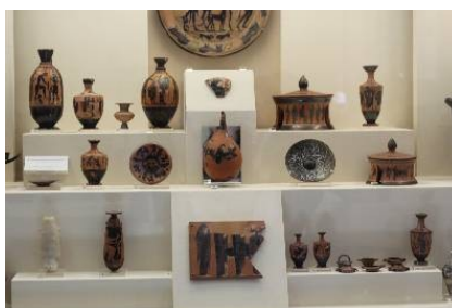
Από την επίσκεψη στον Κεραμεικό