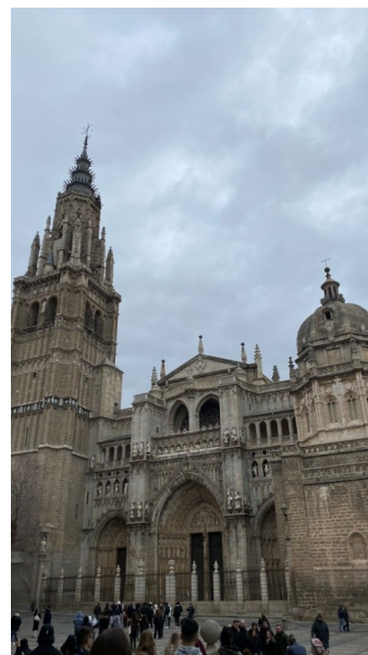
Μαδρίτη - Ισπανία