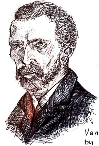
Van Gogh by Stathis L., A1

When the river dries, Death awaits for you Wait for the clouds to arrive. Hiding in the shadows now Here comes the rainbow. And cold like ice. Anonymous Anonymous