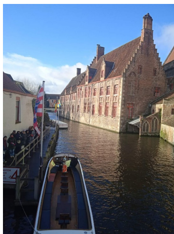
Μπριζ - Βέλγιο