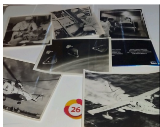
Από την έκθεση Life in Space

Deep in the water softly moving its fins a crab, dreaming. Anonymous